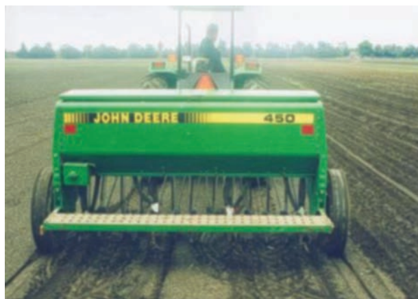
Una cama de siembra de buena calidad no debe presentar terrones

Grandes cantidades y/o la distribución desigual de los residuos de la cosecha pueden ocasionar problemas de colocación de las semillas, quedando algunas semillas entre la paja.