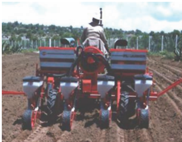
La velocidad de siembra debe ser a un ritmo lento y uniforme

7) Velocidad de la siembra: ¡Más despacio! Esto garantiza la uniformidad de la distribución de las semillas y su emergencia, junto con una buena distribución del fertilizante al mismo tiempo. Si es necesaria una mayor velocidad de siembra para cubrir una mayor superficie en menor tiempo, debe saber que esto afecta la emergencia y finalmente, la densidad de población.