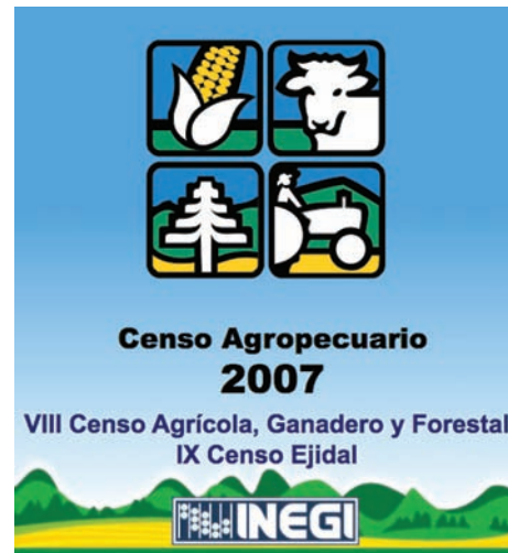
Los resultados del Censo Agrícola 2007 se publicaron a finales de marzo de 2009

dos por los censos agropecuarios anteriores. La temática censal abordó aspectos sustantivos de la estructura productiva y de las características económicas, organizativas y tecnológicas de las unidades de producción. Asimismo, dedicó un apartado específico a la investigación relacionada con las características sociodemográficas de los productores agropecuarios y forestales.