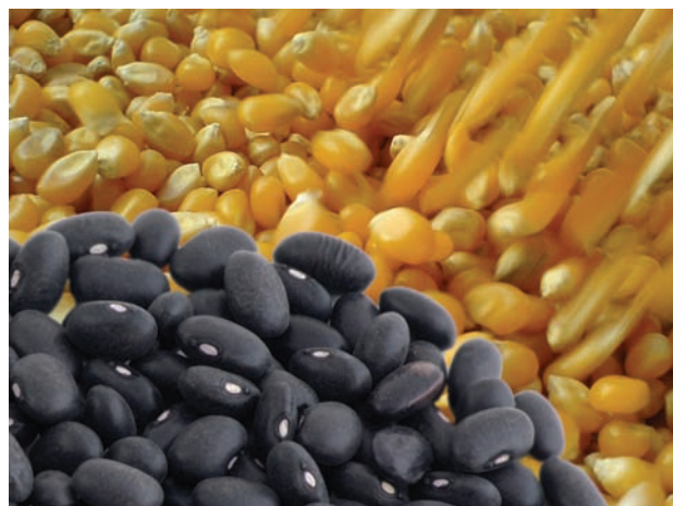
Los cultivos maíz, frijol y sorgo ocupan el 78% de la superficie agrícola del país

Los cultivos anuales de mayor importancia en México fueron: maíz, frijol y sorgo, que en conjunto ocuparon el 78.4% de la superficie sembrada en el ciclo agrícola 2007. De ellos, el más destacado es el cultivo de maíz, con el 28.7% de la superficie sembrada en el ciclo agrícola 2007, cuya producción se concentró en los estados de Sinaloa, Jalisco, Guanajuato, Michoacán y Chiapas que sumados aportan el 51.2% de la producción nacional.