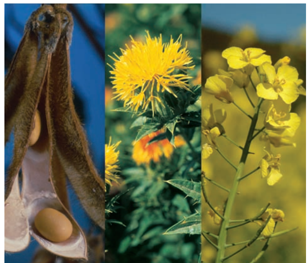
El 2 de marzo de 2009 se publicó la declaratoria de normas de oleaginosas en el Diario Oficial de la Federación

Las normas a las que se hace referencia entrarán en vigor a los 60 días naturales después de la publicación de dicha Declaratoria de vigencia en el Diario Oficial de la Federación.