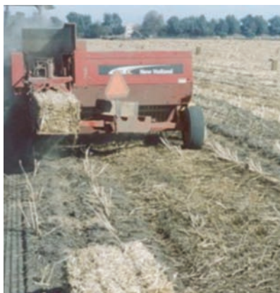
La incorporación de los residuos de cosecha al suelo, a la larga puede redituar mayor productividad que empacarlos para forraje

Si se incorporan los residuos que quedan después de una buena cosecha de canola, se estará aportando al suelo el material necesario para producir en promedio 1,500 kg de humus por hectárea, cantidad que compensa las pérdidas anuales; por lo que esta práctica puede ser una mejor alternativa para conservar la fertilidad del suelo que el estiércol de bovino, pues la aplicación de 10 ton de éste aportan aproximadamente 900 kg de humus por hectárea por año.