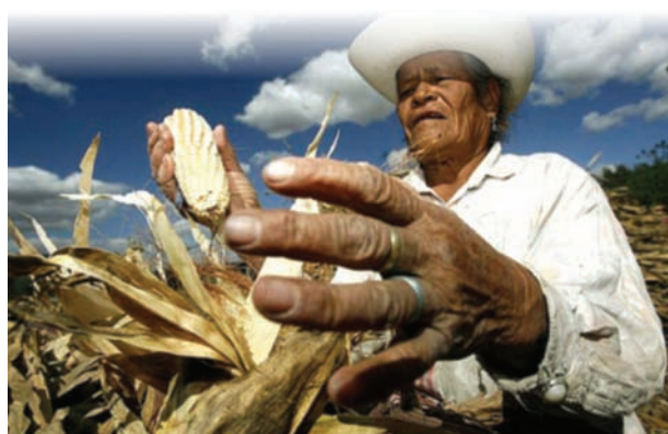
Según el Censo Agrícola 2007, el 84 % de los agricultores son hombres

En cuanto al perfil sociodemográfico de los productores agropecuarios y forestales del país, destaca que el 84.0% de los responsables de las unidades son del sexo masculino; 26.8% de titulares de las unidades son hablantes de lengua indígena. Cerca de 7 de cada 10 productores agropecuarios y forestales que hablan lengua indígena se localizan en los estados de Chiapas, Oaxaca, Veracruz, Puebla e Hidalgo.