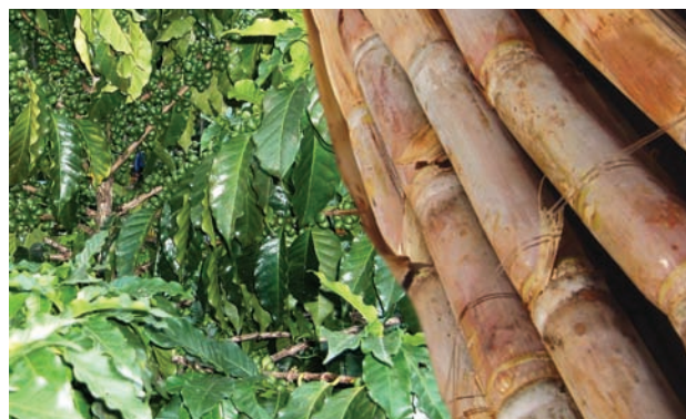
Los cultivos perennes más sobresalientes, según el Censo fueron café, caña de azúcar y naranja

Por su parte, los cultivos perennes más sobresalientes son: el café, la caña de azúcar y la naranja. El café se cultivó en 718 mil hectáreas y las entidades que aportaron cerca de tres cuartas partes de la producción nacional fueron: Chiapas, Veracruz y Oaxaca.